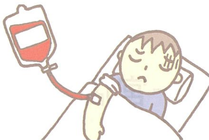
■輸血や臓器の移植を受けたことがある方