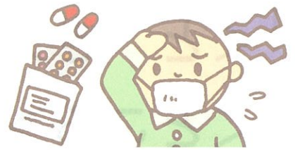
■熱があるなど健康状態が良くない方 ■現在、治療中または治療用の薬を飲んでいる方