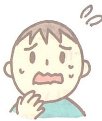
■梅毒、C型肝炎、マラリア、シャーガス病にかかったことがある方