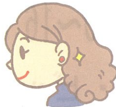
■半年以内にピアスホールを開けた方 医療機関、専門店でディスポの器具により 行った方は1ヶ月後であれば願ひできます