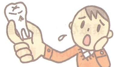
■3日以内に抜歯または歯科治療(歯石除去を含む)をした方