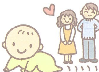
■現在妊娠中、授乳中または過去6ヶ月以内に 出産・早流産された方