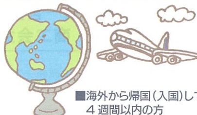
■海外から帰国(入国)して4週間以内の方 ■昭和55年(1980年)以降、ヨーロッパの 対象国に滞在(居住)された方(国名・期間等、詳しくは受付におたずねください)

上記以外にも輸血を受ける患者さんや献血者の安全を確保するため、医師が献血をお断りすることがあります。ご了承ください。