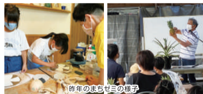
昨年のまちゼミの様子

「まちゼミ」とは商店と消費者との交流を通して、商店のファンづくりと地域活性化を図ることを目的に、店主やスタッフが講師となり、プロならではの専門知識や情報、コツを無料で受講者(消費者)にお伝えする少人数のゼミナールです。小学生等と保護者を対象に「まちゼミKids」を開催いたします。毎年大変ご好評をいただいています夏休みの思い出づくりにぜひご参加ください。詳しい開催内容は公式HPにてお知らせします。