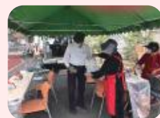
献血事業運営協力

商工会の会員(法人の場合、その役員)もしくはその配偶者又は商工会の会員の親族であって、その事業に従事している女性の方。