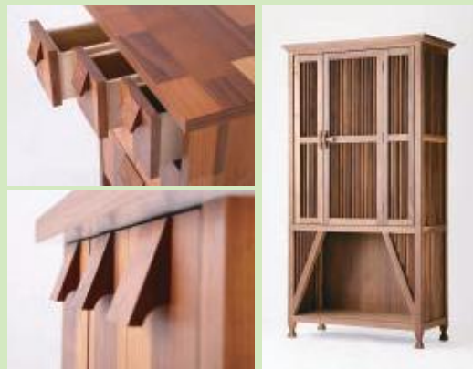
春日木工株式会社 〈木製家具製造業〉 岡山市北区富原3883-1 TEL 086-255-5571

これからも補助金制度についての情報や活用について商工会のご支援をいただければ幸いです。