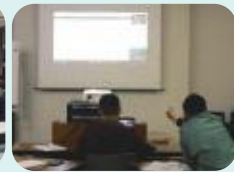
おかも後継者アカデミーWEB受講