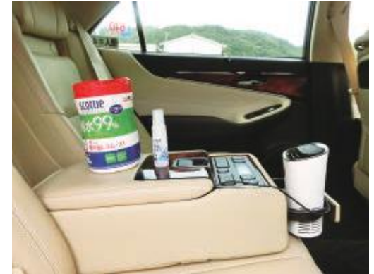
タクシー車内にコロナ対策