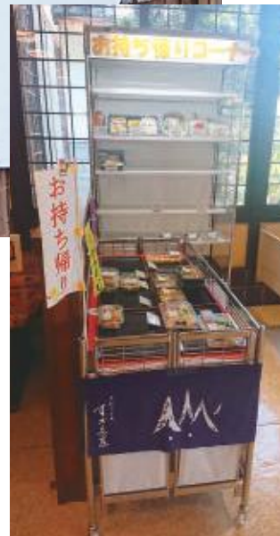
テイクアウトの強化