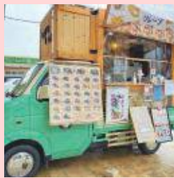
MS CREATE BOM CREPE 〈飲食業〉 岡山市東区東平島1163-3 TEL 090-4800-3159