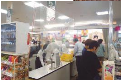
レジ前にパーテーション設置