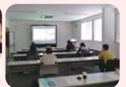
WEBを活用した講習会