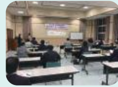
クラウドファンディング活用セミナー

商工会の会員(法人ではその役員)又はその親族若しくはその後継者と認められる者であり、かつ、その会員の営む事業に従事している満45歳以下の方。