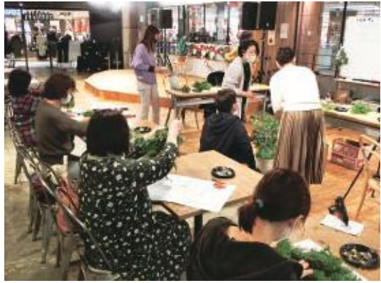
サンフラワー × サニーデイ コーヒー [クリスマス飾り作り & コーヒーの淹れ方講座]

岡山北商工会では、「お店と街のファンづくり」としての体験型販促イベント「まぢゼミ」を開催しており、今年で7年目の実施となりました。今年は新型コロナウイルス感染症の影響で、夏の「キッズ」は開催延期となり、一般型「まぢゼミ」と合同で2020年11月～12月にかけて開催しました。コロナ渦でもWEB中継による講座開催など工夫を凝らし、個店のサービスや事業者の人柄を直接消費者にアピールする機会となりました。