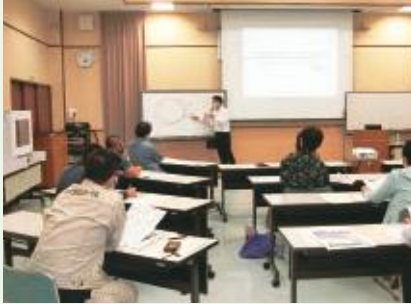
セミナー実施風景

参加者自身のチラシについてのアドバイスは説得力もあり非常に満足度の高いセミナーとなりました。