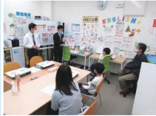
PCらいふパソコンスクール津高校 [キッズロボットプログラミング講座]

得する街のゼミナール、略して「まぢゼミ」。「三方よし」とは、「お客様」「お店」「地域」のみんなにとって良いという事です。お店が講師となり、お店やひとの存在・特徴を知っていただくと共に、お店（店主やスタッフ）とお客様のコミュニケーションの場から、信頼関係を築くことを目的とする事業です。