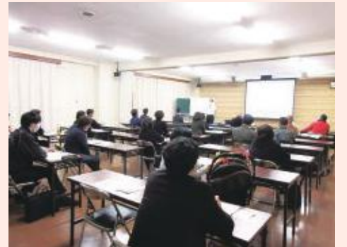
創業セミナー（津高支所）

皆さん、夢の実現に向けて計画的に頑張りましょう～！不安な時は商工会までご相談ください。