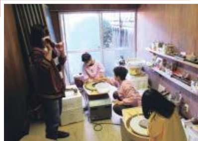
つくも陶工房【御津】