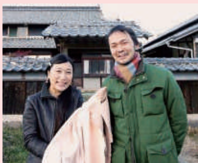
建部獣皮有効活用研究所 〈獣皮加工・革製品製造販売〉 岡山市北区建部町 TEL 080-4823-1777

当初予定した事業計画よりも順調に活動を広げることができ、商工会の皆様をサポートしていただきました事に本当に感謝しています。