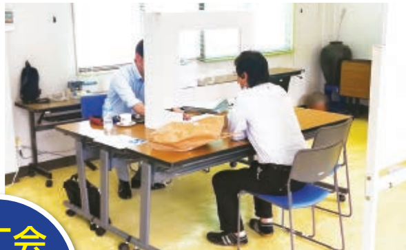
感染防止パーテーションを設けての相談対応