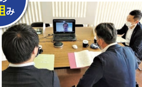
ビデオ通話システムによるWEB会議