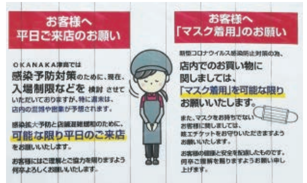
マスク着用と入場制限を案内する店舗のPOP