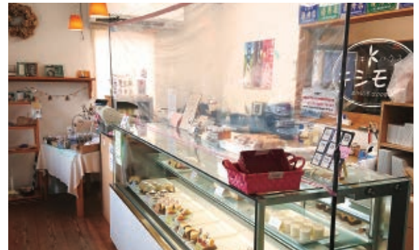
飛沫防止カーテンを設けた店舗の様子