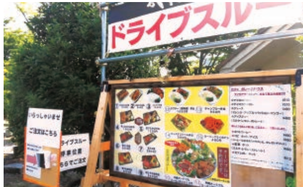
ドライブスルーでの提供スタイル