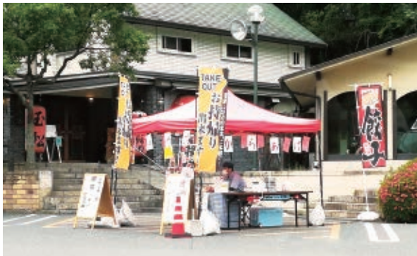
お持ち帰り専用ブースを設ける店舗