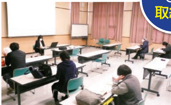
3密を避けてのセミナー開催の様子