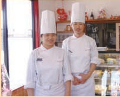
Patisserie Juna 〈洋菓子製造・販売〉 岡山市北区一宮94-2 TEL 086-284-8540