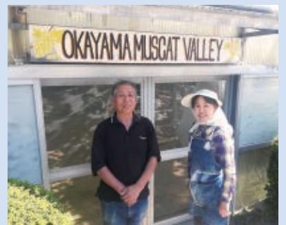
スコレー 〈果物生産販売〉 岡山市北区御津吉尾447 TEL 086-724-4390

商品のキャンセルが相次ぎ途方に暮れていたところ、商工会からクラウドファンディングの提案がありました。クラウドファンディングはこれまで全く無縁でしたが、お客様に伝わるストーリー作りや、最適な返礼品の選定について、商工会から丁寧に指導をしていただけました。クラウドファンディング活用のおかげで資金を集めることができ、新型コロナウイルスによる危機をどうにか乗り越えることができそうです。本当に感謝しています。