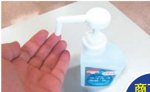
商工会窓口に設置している消毒液