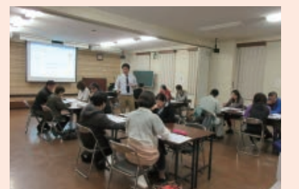
短期集中型「創業塾」

岡山北商工会では、経理や税金に関するだけでなく、創業計画の作成、融資の斡旋、創業補助金の申請などあらゆる面でサポートしますので、いつでもご相談ください。