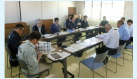
中小企業庁長官との情報交換会