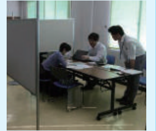
補助金申請に関する個別相談会