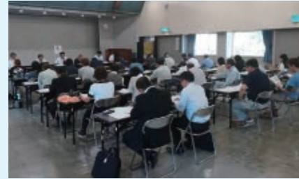
グループ補助金説明会