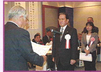
表彰を受ける寺岡会長