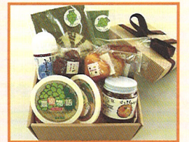
「桃太郎の郷 くだものづくし」