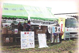
マスカットまつりでの献血活動の風景

献血は難しくないボランティアです。どんなに科学・医学が進歩した現在でも血液を人工的に作り出すことはできません。今日もどこかで病気や怪我などで輸血を必要としている人の尊い命が救われています。