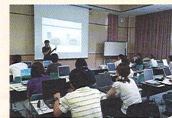
7月8日 デジカメ講習会

昨年度開催された「商工会女性部ふるさと小包コンテスト」に出品した詰め合わせセットを3,000円(税込み・送料別)で販売しています。岡山北商工会女性部が選んだ商品は、晴れの恵みをいっぱい受けたくだものづくしです。大切な方にプレゼントしてはいかがでしょうか?他の商工会の詰め合わせも注文できます。詳しくは、本部・支所の窓口にあるパンフレット、またはホームページ( http://www.kodutumibin-okayama.com/ )をご覧ください。