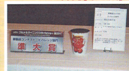
トマト味の野菜ヨーグルト (建部ヨーグルト)