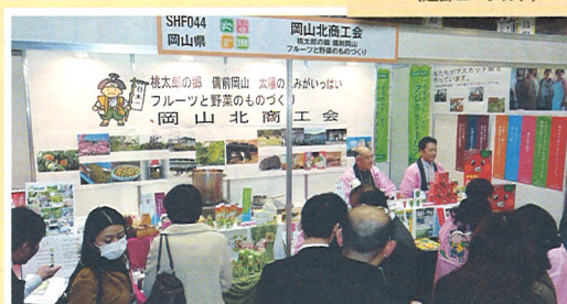
「第9回グルメ&ダイニングスタイルショー春2011」 東京ビックサイト(東展示棟3ホール)