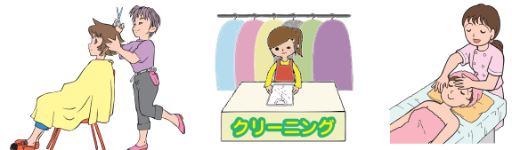
一事業所当たり人口・従業者数等 (出所：人口：平成27年10月末、事業所数：平成26年経済センサス)

特に人口比、事業所比からみて少ないのは津高です。次いで一宮、御津が少なくなっています。他の地域は65歳以上人口比で岡山市北区と一事業所あたり人口が近くっており、特に上道は競争が厳しくなっている可能性があります。今後の人口推移をみると、一宮、津高、上道では引き続き高齢者人口は増加する見込みとなっており、マーケット自体は拡大します。