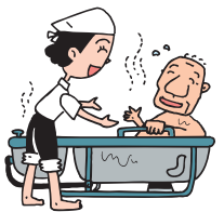
事業所数・一事業所当たり要介護認定者数

介護事業者の現状(岡山市)をみると、要介護認定者数では北区の人数が少なく(事業所数が多い)、東区は人数が多い(事業所数が少ない)状況となっています。要介護認定者数と事業所数は毎年変化しますので、開業しようとするときに改めて確認しておくことをお勧めします。