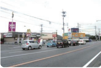
上道地区 平島交差点付近

創業するにあたっては、人口と共に交通量が重要とされています。そこで、国道の交通量をみると、国道2号線では、上道エリアの竹原では24時間で約27,000台が通行しています。国道53号線では、津高エリアの津高では24時間で約43,000台、御津エリアの御津野々口では約22,000台が通行して、それなりに交通量があることがわかります。