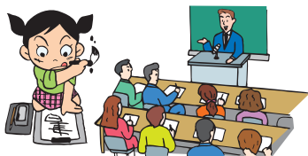
一事業所当たり人口・事業所数等 (出所：人口：平成27年10月末、事業所数：平成26年経済センサス)

特に人口比、事業所比からみて少ないのは御津です。御津に統計上1事業所しかカウントされていないことから、このような結果となっています。次いで上道が少なくなっています。逆に建部は人口比での事業所数が多くなっています。