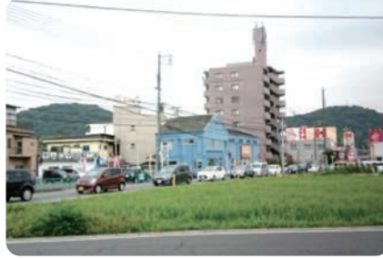
津高地区 横井付近