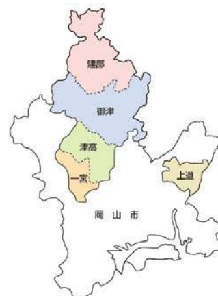
(岡山市と岡山北商工会管内の位置関係図)

岡山北商工会の管轄地域は、右図が示すとおり岡山市の北部・東部に位置しており、平成18年4月の合併で北部(現：北区)の「一宮・津高・御津・建部」地区と東部(現：東区)の「上道」地区の5つで構成されている。